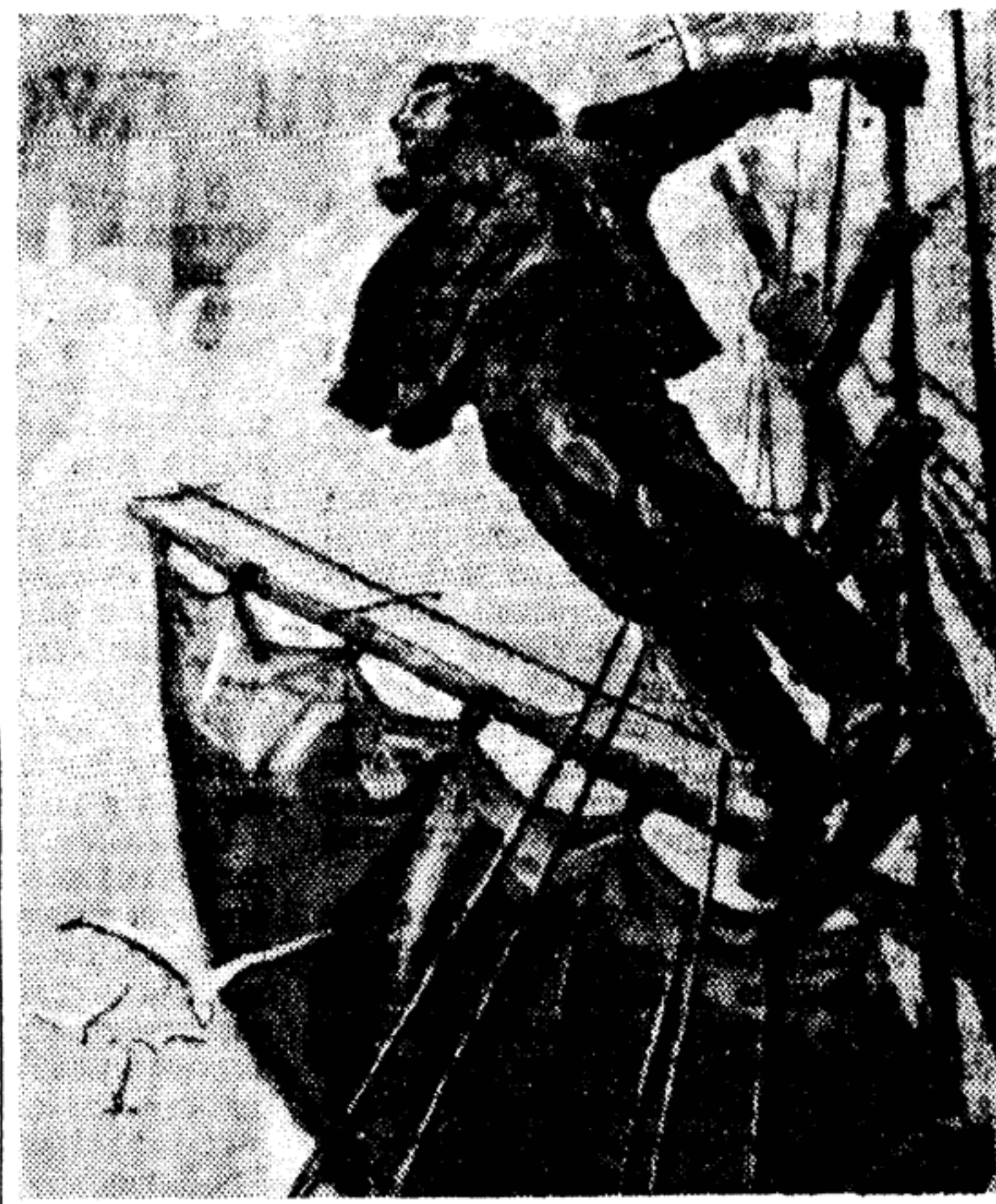
Юноша, крепко схватившись за манат, всматривается в морскую даль. Светлый горизонт устремлен вперед, свойственный всей нашей молодежи, чувствуется в его облике. «Юнга» так называется это большое полотно молодого художника А. Рыбачука, отобранное жюри на международную художественную выставку.

На всех языках мира будут звенеть в эти дни на московских улицах слова великой дружбы молодежи. Там встретятся новые и старые друзья, там возникнет между тысячами людей из разных стран глубокая и прочная дружба. Дружба — враг войны. Дружба — символ мира. И мы знаем, что именно мысль о мире, ненависть к кровавой войне объединят участников фестиваля — независимо от их расовой принадлежности, религиозных верований и политических убеждений. Желаем всем участникам фестиваля, всем, кому пожелают в эти прекрасные, полные творческого горения дни побывать в Москве, пожелаем всем нашим молодым друзьям большого успеха на их чудесном празднике.