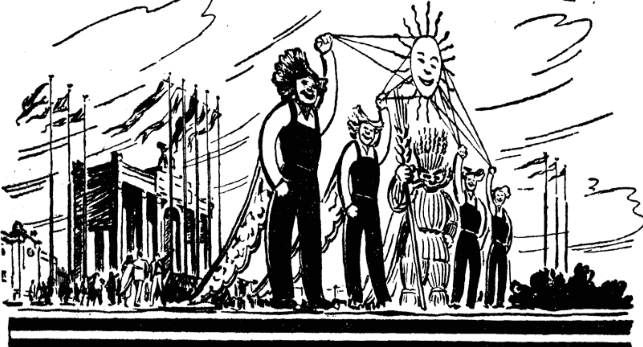
От Выставки до Стадиона Сивозь всю Москву, поток бурли!

Этот правдивый рассказ поможет вашим друзьям и согражданам лучше понять мир, в котором они живут, а ведь без такого понимания нельзя действовать уверенно и плодотворно.