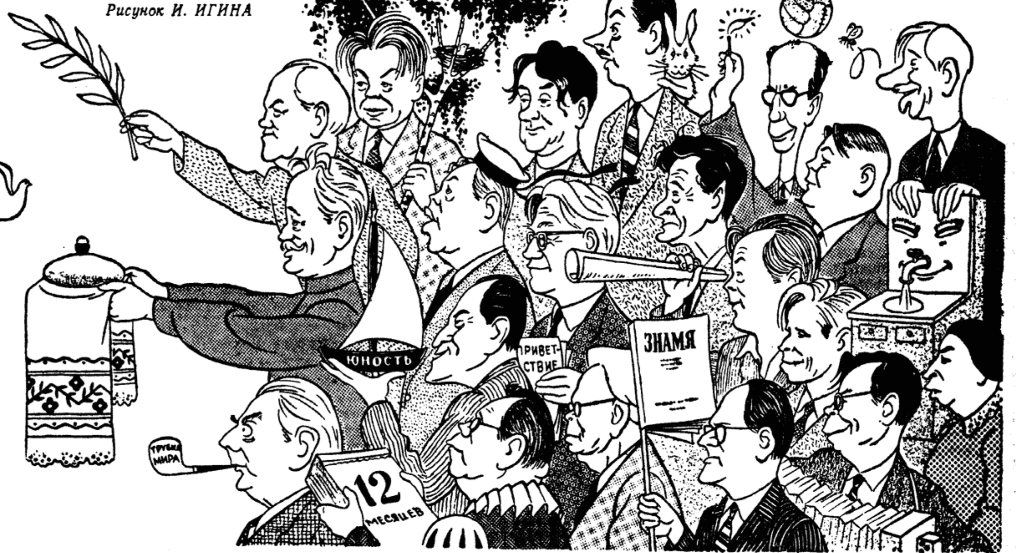
Рисунок И. ИГНА

В Москву с пяти концов планеты Посланные держат свой маршрут. Чем выйдут их встречать поэты? Чем их прозники почтут?